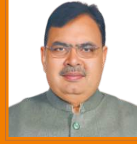
श्री भजन लाल शर्मा माननीय मुख्यमंत्री